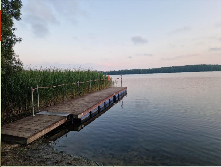
Wymiana infrastruktury kąpieliska w Stnicy Harcerskiej w Drężnie - wymiana starego pomostu na nowy pomost pływający Grantobiorca: Stowarzyszenie Stanica Harcerska Drężno