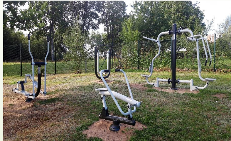
Budowa siłowni zewnętrznej w miejscowości Radacz Grantobiorca: Stowarzyszenie Mitośników Miejscowości Radacz