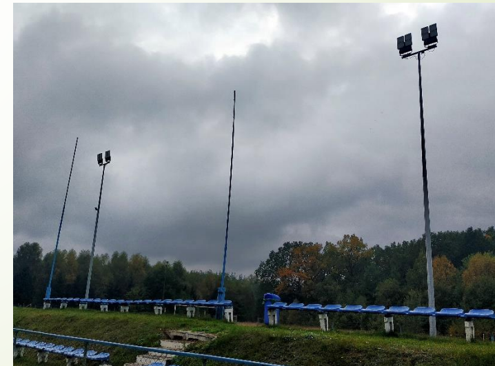
Modernizacja oświetlenia obiektu rekreacyjnego w m. Łubowo, gm. Borne Sulinowo, kwota dofinansowania: 30495,00 zł