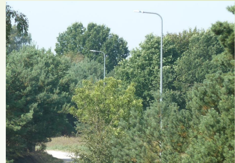
Zwiększenie dostępności do infrastruktury turystycznej poprzez budowę oświetlenia drogowego w miejscowości Spore, gm. Szczecinek, kwota dofinansowania: 53652,00 zł