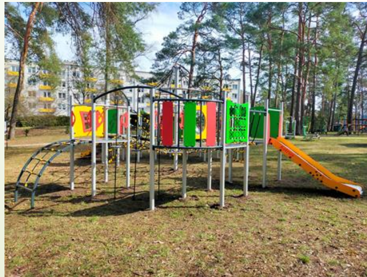
Plac zabaw w Gminie Borne Sulinowo