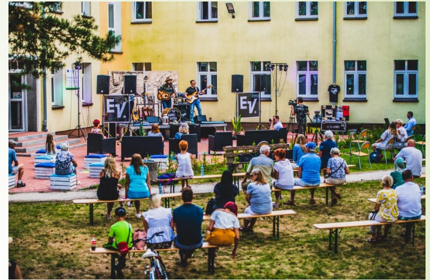
Łoża prasowa w Miejskiej Bibliotece Publicznej w Bornem Sulnowie - utworzenie łoża prasowej przy Bibliotece Publicznej Grantobiorca : Miejska Biblioteka Publiczna w Bornem Sulnowie